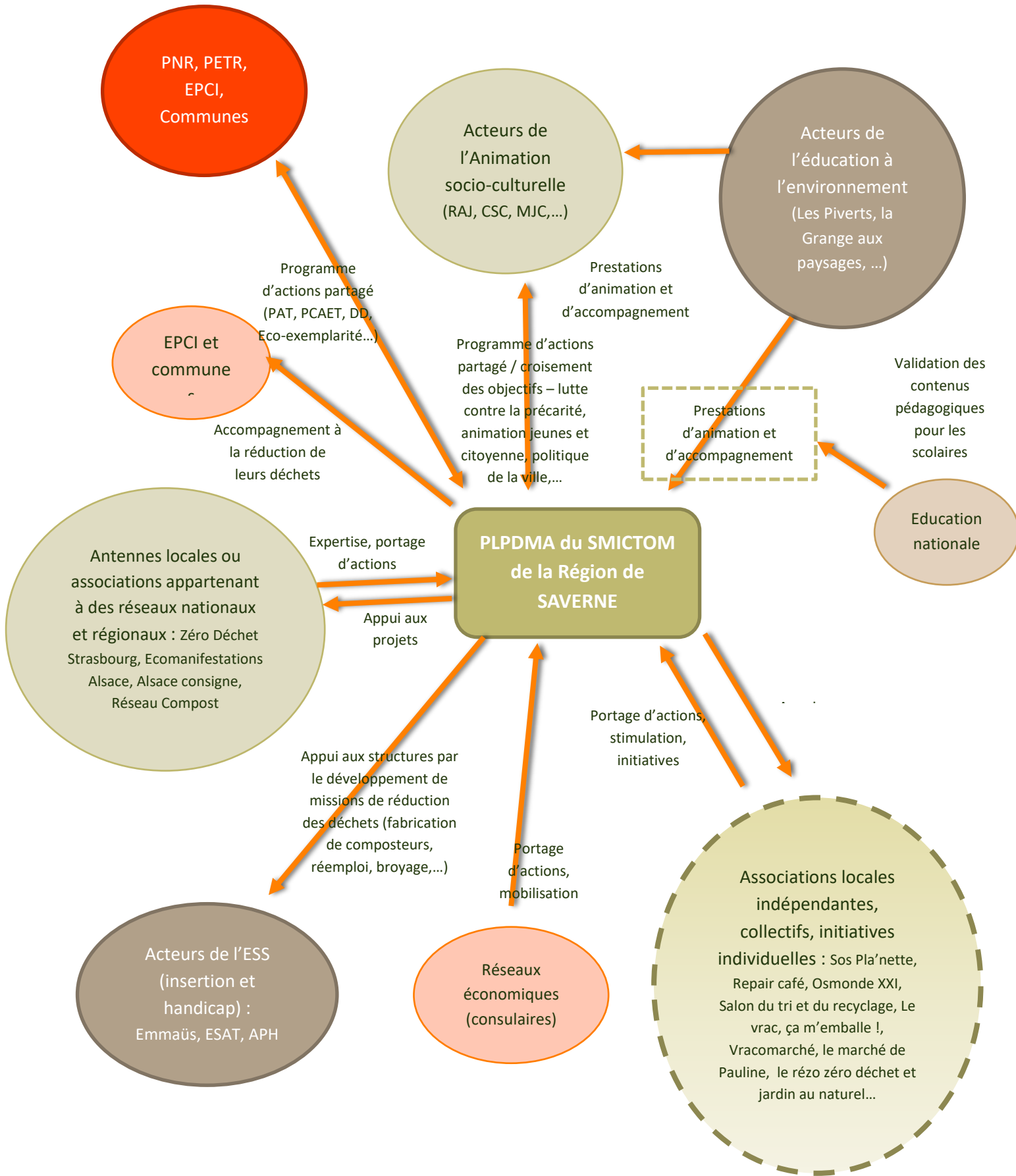
Figure 2 : PLPDMA SAVERNE – Cartographie de acteurs – février 2022